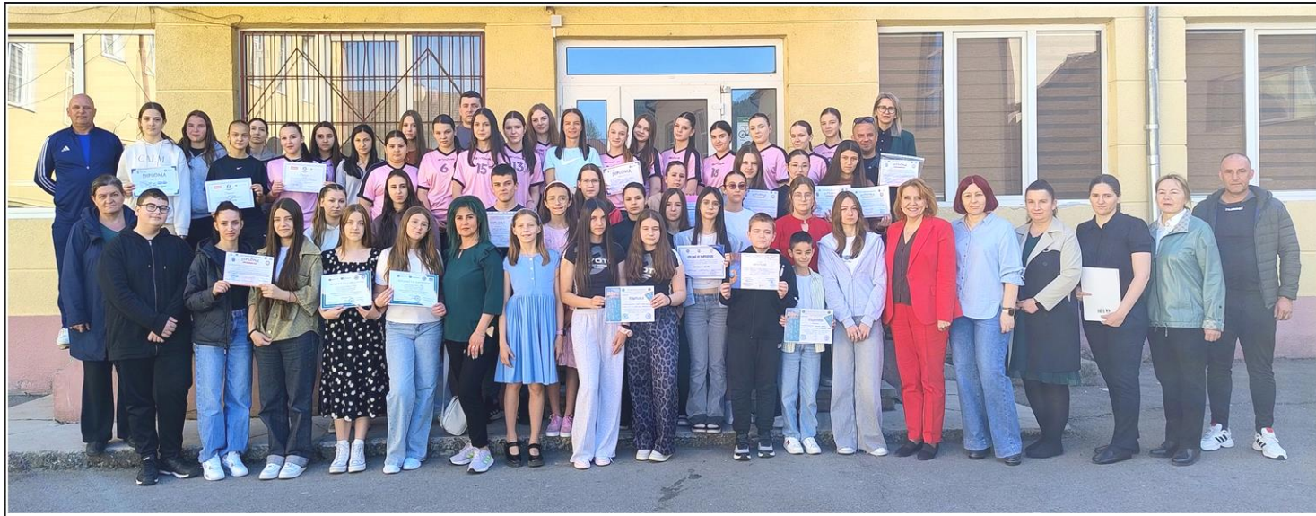
Olimpicii Liceului Tehnologic „Liviu Rebreanu” Maieru, alături de cadrele didactice care i-au pregătit