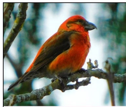
Forfecuță, mascul ( Loxia curvirostra )

Un păianjen ( Pysaura mirabilis ) ne taie calea fără să se asigure. Circulă pe zăpadă ca