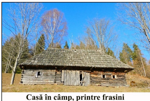
Casă în câmp, printre frasini

Ajung la prima casă în câmp. De fațada casei, atârână într-un cui o pereche de foarfece de tuns oile. Taie brici, deși e cam ruginită. Tabla ieftină cu care au fost