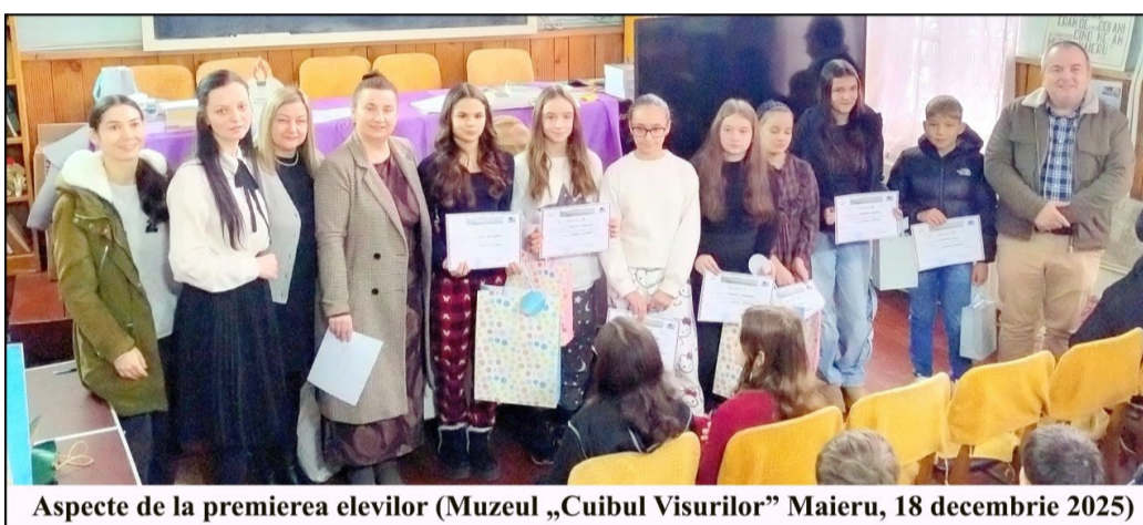
Aspecte de la premierea elevilor (Muzeul „Cuibul Visurilor” Maieru, 18 decembrie 2025)

Dar, dincolo de peisaj, satul meu este o comunitate. Aici, oamenii nu sunt doar vecini, ci o mare familie extinsă. O ușă deschisă înseamnă bun-venit, iar o masă de sărbătoare înseamnă întotdeauna un scaun în plus. Legăturile dintre oameni sunt autentice și puternice, bazate pe ajutor reciproc și pe o înțelegere tacită a vieții. Hărnicia și bunătatea lor dau locului un farmec aparte.