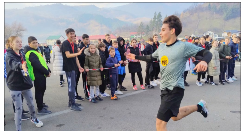
Aspecte de la Memorialul Maria Cioncan – ediția a XVIII-a (Anieș – 15.11.2025)