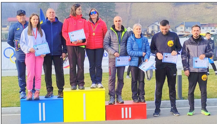
Profesori premiați, la cea de-a VIII-a ediție a Memorialului Maria Cioncan

Ne-am clasat pe locul II în ierarhia celor 18 școli participante. Copiii noștri au fost printre cei mai