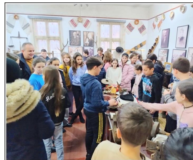
Obiecte vechi pentru generații noi Muzeul „Cuibul visurilor” Maieru (decembrie 2024)