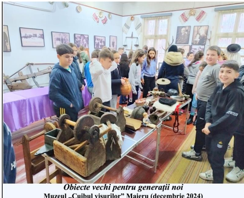
Obiecte vechi pentru generații noi Muzeul „Cuibul visurilor” Maieru (decembrie 2024)

măierean, aducând cu ei toate obiectele strânse, fiecare cu ceea ce a găsit prin podul părinților, al bunicilor, al străbunicilor, prin alte și alte locuri de care doar ei știu. Încărcați ca și albinele când se întorc în stup, am putut să citesc pe fețele lor