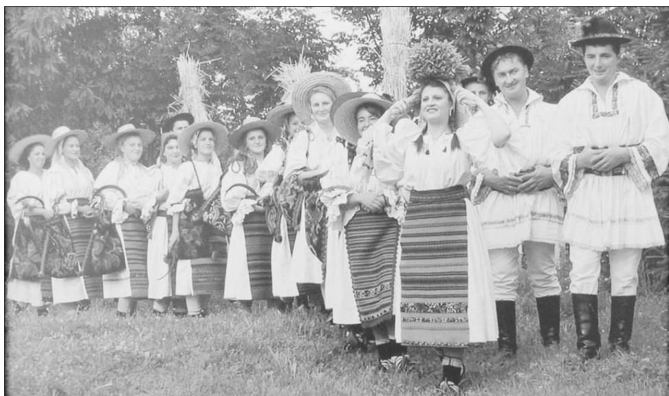
Ansamblul Cununa Maierului – tânăra generație (anii 2000)