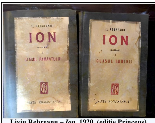
Liviu Rebreanu – Ion , 1920 (ediție Princeps)