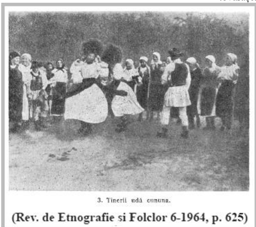
3. Tinerii udă cununa.

Mai trebuie precizat că acest text nu-i era cunoscut și nu figurează în Bibliografia Elisabetei Moldoveanu . Apare, în schimb, la Bibliografia lucrării "Bichigean, Gavril, Gogea sau cântarea cununii la sfârșit de secerat" , în „Comoara satelor”, 4. 1926, nr. 5-6" — aceasta fiind o versiune culeasă de Gavril Bichigean din Feldru și publicată sub titlul de mai sus în anul 1926.