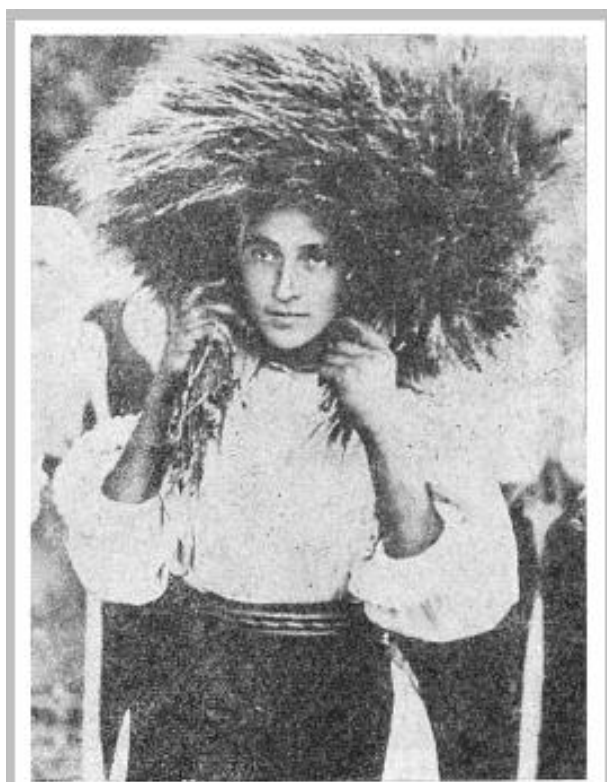
1. O fată poartă cununa.

(Rev. de Etnografie și Folclor 6-1964, p. 623)