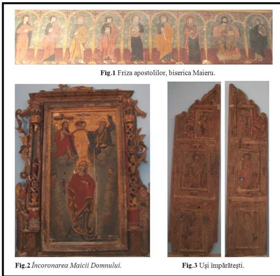
Fig.1 Friza apostolilor, biserica Maieru.