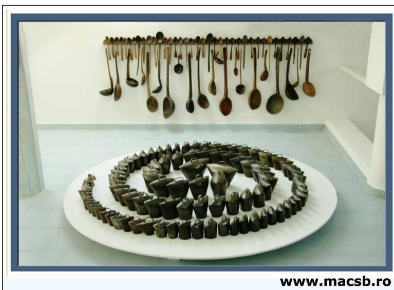
De îndată ce-i vom trece pragul în prima sală a Muzeului de Artă Comparată din

Muzeul de Artă Comparată Sângeorz-Băi al lui Maxim Dumitraș expune arta noastră tradițională îmbrăcată, ca să spun așa, în straie noi menite să dezvăluie mesajul peren, mai presus de materie și de artefactul ca atare, într-un cadru extins – un cadru comparativ de confruntare estetică. Și am să mă mărginesc în pledoaria mea pentru muzeul sângeorzean la un singur exponat, creat și expus în muzeu.