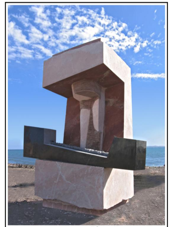
Maxim Dumitraș - Pieta (marmură) Fuerteventura, Spania (2006)