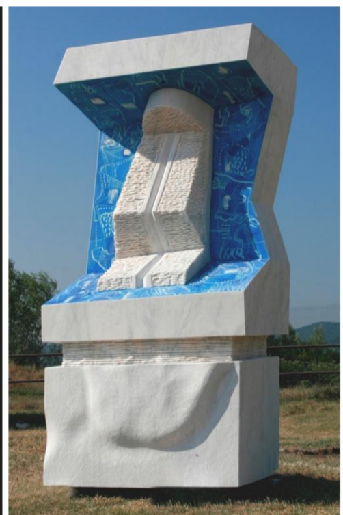
M. Dumitraș - Privire interioară (marmură) Caransebeș, 2012