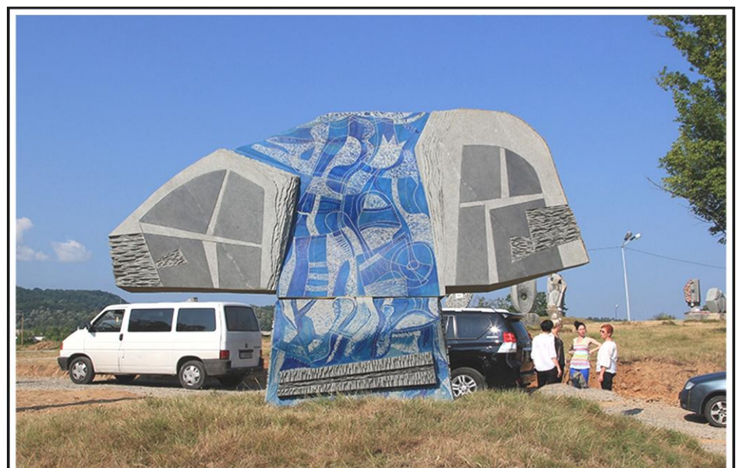
Maxim Dumitraș - Cămașă (andezit)