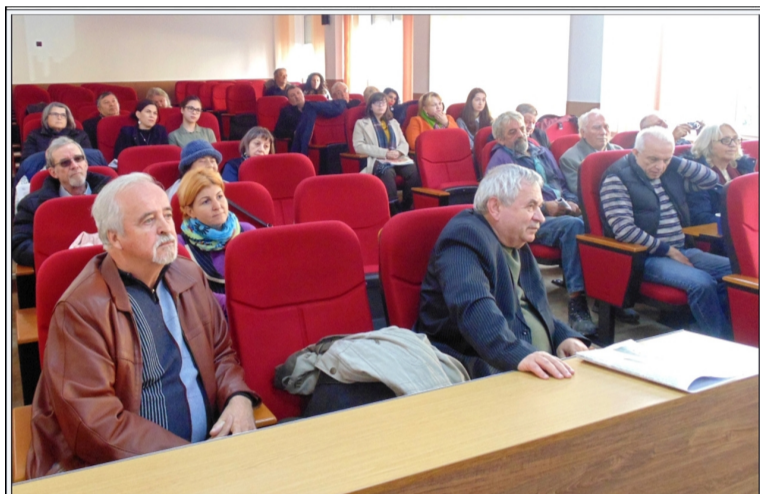
Saloanele Liviu Rebreanu – Maieru (noiembrie 2019)