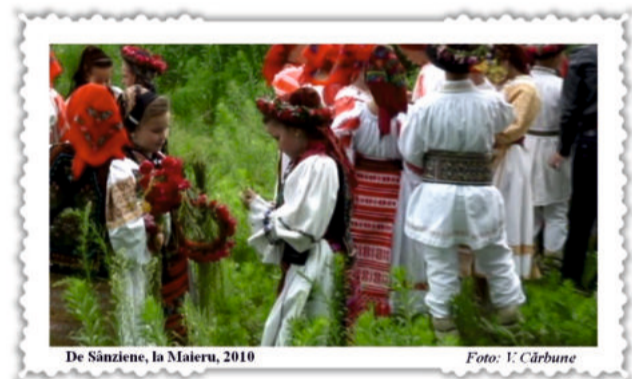
De Sânziene, la Maieru, 2010

Lor să le facă cunună Acum cîn' îi vreme bună, Să le-o pună peste cap La drăguțu' car' l-i drag.