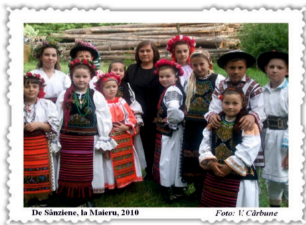
De Sânziene, la Maieru, 2010