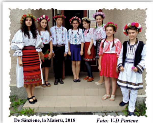
De Sânziene, la Maieru, 2018

Doi băieți mai îndrăzneți Și – de fe! – cam cucuieți Lemne și ciurcele-adună