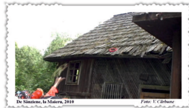
De Sânziene, la Maieru, 2010