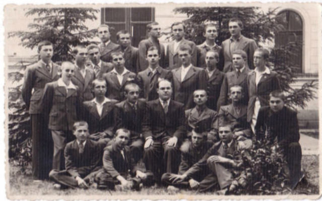
CLASA a V-a Liceu 1937-1938 Lic. G. Coșbuc Tatăl meu este în rândul de sus, al 3-lea de la stânga la dreapta.