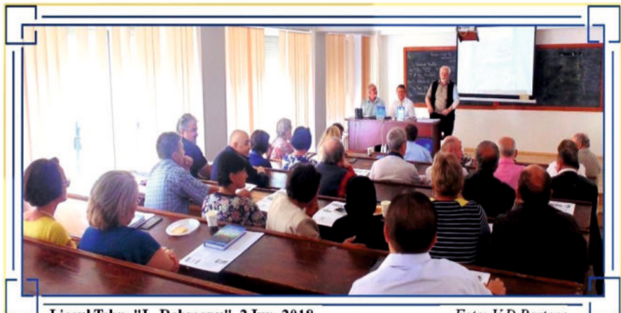
Liceul Tehn. "L. Rebreanu", 2 Iun. 2018