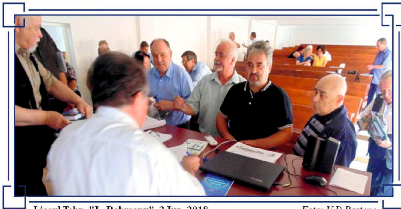
Liceul Tehn. "L. Rebreanu", 2 Iun. 2018

Prima parte „Mereu în cumpănă, gândul...” este alcătuită din cinci secvențe autonome: „Lumina copilăriei”, „Între cuib și zbor”, „Stropi de iubire”, „Stropi de singurătate” și „Stropi de viață”. În deschidere, un poem emblematic al lui Lazăr, intitulat sugestiv „Prolog”, trece în revistă mesajul cărții, aflăm că este cea de-a treia spovedanie de această factură, după Memoria inimii , Editura „Semne”, București,