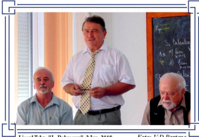
Liceul Tehn. "L. Rebreanu", 2 Iun. 2018