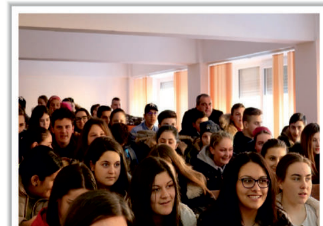
Maieru, sala Liceului Tehnologic, 31/01/2018

1918 LA ROMANI DOCUMENTELE UNIRII, doc. 113, p. 83.