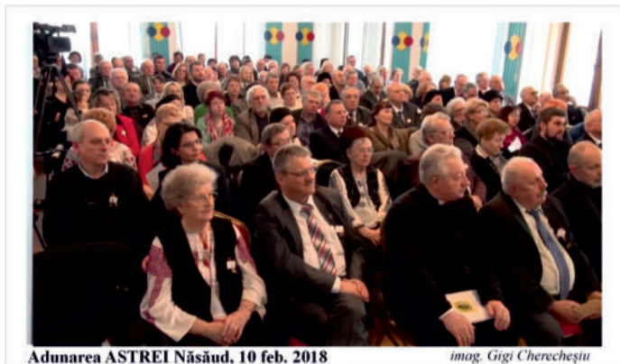
Adunarea ASTREI Năsăud, 10 feb. 2018