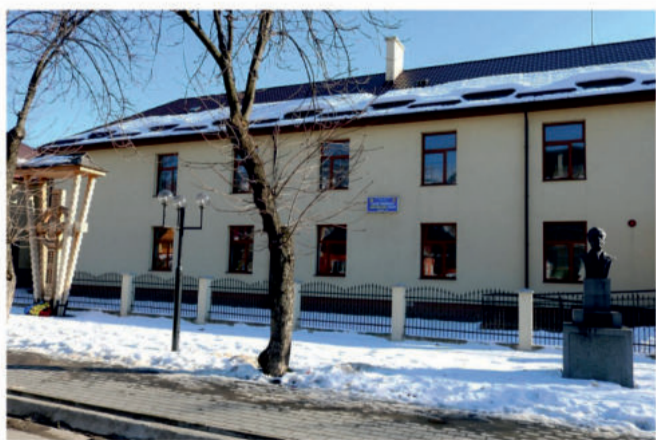
Maieru, Liceul Tehnologic

Într-o atmosferă sărbătorească, s-au desfășurat în perioada 20-29 noiembrie alegerile delegaților la Marea Adunare Națională de la Alba-Iulia. Au scris prin depunerea credenționalelor și participarea la Marea Adunare de la Alba-Iulia un număr de 62 de reprezentanți din localitățile județului, delegați alesi – titulari și supleanți – și de drept (reprezentanți ai bisericii, învățământului, reuniunilor/societăților, desemnați de cercurile electorale (5, de fiecare, pentru Beclean, Bistrița, Năsăud), instituții sau localități.