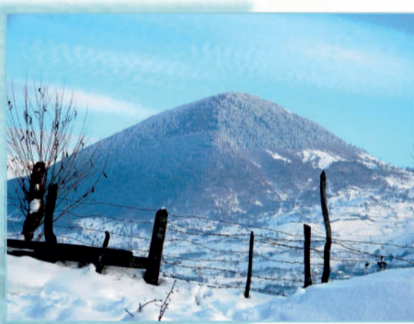
Măgura cu omături, Maieru, 2018

Foi, file, pagini asemenea, ba de cruntă cremene, ba de moale dulce lene! S-a mai încălzit inima asprului