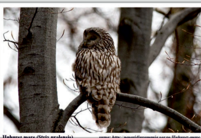
Huhurez mare ( Strix uralensis ) sursa: http://pasaridinromania.sor.ro/Huhurez-mare

Prea mult biciuiți de rafale, deviem de la obiectiv și intrăm pe Valea Hânțoaia unde aproape că domnește acalmia. Trecem deasupra unei livezi și dăm peste o vâlcea tivită cu arbuști feluriti. Într-un măceș, ne atrage atenția o siluetă bondoacă, imensă. Binoclul ne simplifică identificarea: un huhurez mare ( Strix uralensis ). Strig: Ura!, însă acest strigid taciturn ura asemenea strigăte, luându-și imediat zborul pe un vârful de clăie, la peste 100m în dreapta noastră. Folosindu-ne