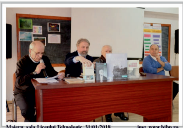
Maieru, sala Liceului Tehnologic, 31/01/2018

„Adunarea națională a tuturor Românilor din Transilvania, Banat și Țara Ungurească adunați prin reprezentanții lor îndreptățiți la Alba-Iulia în ziua de