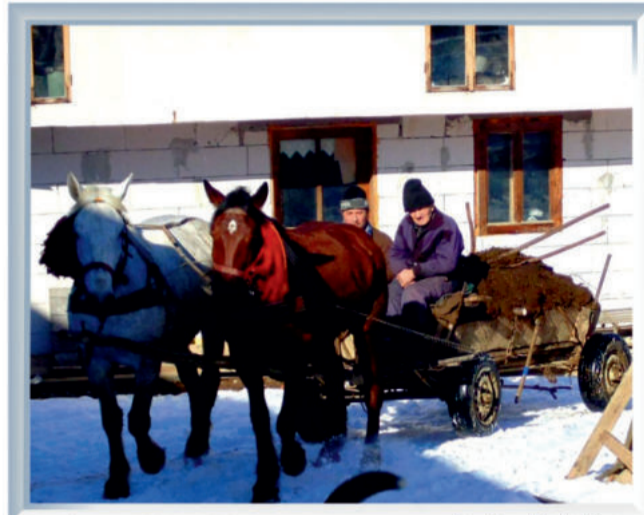
Iarnă de povești, Maieru, 2018

Strigăturile feciorilor s-au auzit până în cele